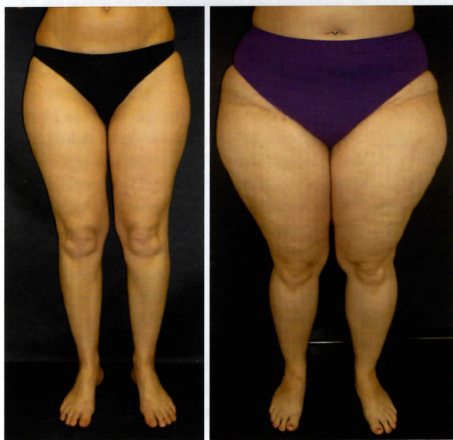
Abb. 1: Stadium 1, geringe Lipohypertrophie, kein Lipödem.

Eine Adipositas-Diagnostik ist bei schwergradigen Ödemen und bei Lipohypertrophie/Lipödem nur mittels Bauchumfang-Größen-Quotient (BGQ = WHtR) möglich (4). Der BMI ist dazu nicht geeignet, da er durch das Gewicht von Ödemen oder Fettgewebsvermehrung besonders der Beine fälschlicherweise überhöhte Werte ergibt.