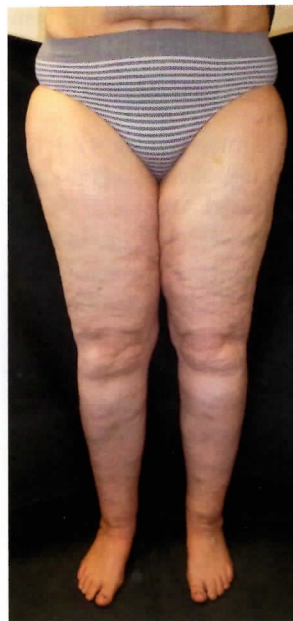
Abb. 3: Stadium 2, mäßige Lipohypertrophie, kein Lipödem.

Die Ergebnisse zeigen, dass ebenso wie bei den Armen die Lipohypertrophie-Typen der Beine korrigiert werden müssen, da