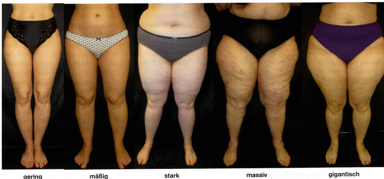
Abb. 7: Lipohypertrophie-Grade nach Herpertz.

Das Stadium 2 mit wellenartiger Hautoberfläche ist am zweithäufigsten und tritt ebenfalls in unterschiedlicher Ausprägung auf, wie auf den Abbildungen 3 und 4 ersichtlich ist. Auch hier wäre keine Liposuktion zulässig, was für die Patientin von Abbildung 4 nicht gerecht wäre.