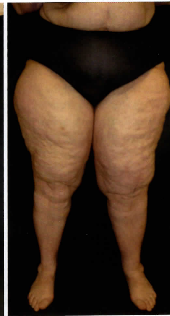
Abb. 4: Stadium 2, massive Lipohypertrophie mit Lipödem.

einerseits ein alleiniger Unterschenkel-Typ ebenfalls nicht bestätigen werden konnte und andererseits auch an den Beinen die lipohypertrophische Mitbeteiligung der Füße und Zehen früher nicht beachtet wurde. Es werden daher jetzt folgende Lipohypertrophie-Typen für die Beine vorgeschlagen: