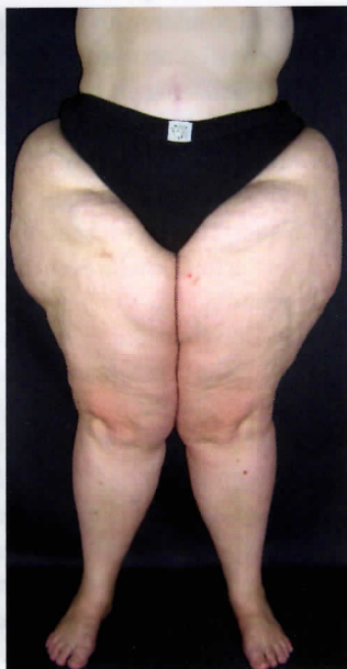
Abb. 6: Stadium 3, gigantische Lipohypertrophie mit Lipödem, keine Adipositas.

Bei zusätzlicher Adipositas kann durch eine Gewichtsabnahme die Beschwerdesymptomatik eindeutig gebessert werden, in einzelnen Fällen können durch eine erhebliche Gewichtsabnahme die Lipödembeschwerden verschwinden. Die Lipohypertrophie kann zwar durch eine Gewichtsabnahme in ihrer Stärke etwas reduziert werden, wird aber auch nach Verschwinden der Adipositas mit Erreichen eines idealen BGQ weiterhin vorhanden sein.